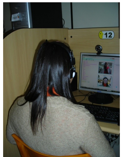
Uma sessão de teletandem