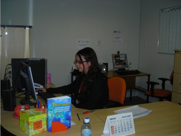
Orientadora na entrada do laboratório, efetuando um turno