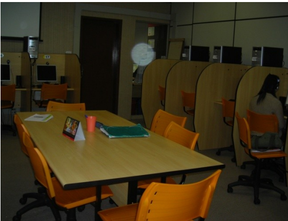
O laboratório de teletandem da Unesp-Assis